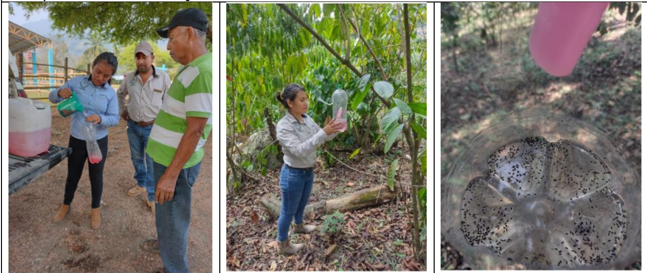
Trapeo de broca del café y Barrenador de ramas en café Robusta.

En el mes de abril se realizó el muestreo de roya en parcelas centinelas en una superficie de 211.50 hectáreas, también se realizó el trapeo de la broca del café y del barrenador de ramas en café robusta en 537.50 hectáreas presentes en la región de Sierra Negra ya que el mismo atrayente atrae a las dos especies de insectos que atacan al grano y a la rama del café robusta respectivamente, se aplicó el control químico en 514.75 hectáreas para la roya del cafeto y se realizaron 21 pláticas técnicas dirigidas a productores. Con estas acciones se beneficiaron a 995 productores cafetaleros.