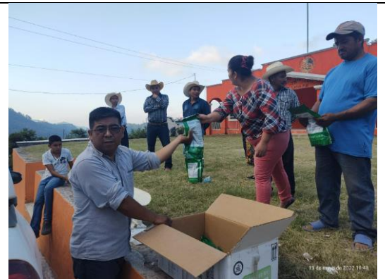
Capacitación sobre el manejo integrado de roya del café